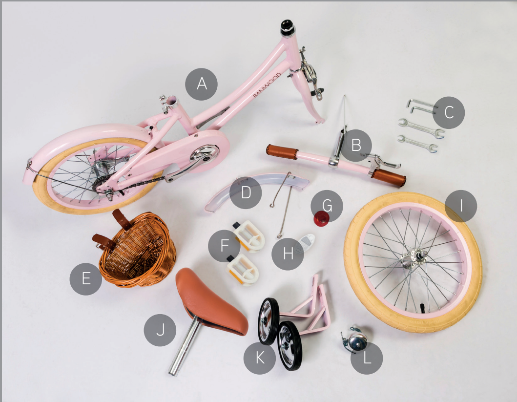
Before assembled Antes de montar